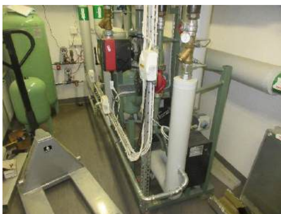
Undercentral för värme och varmvatten