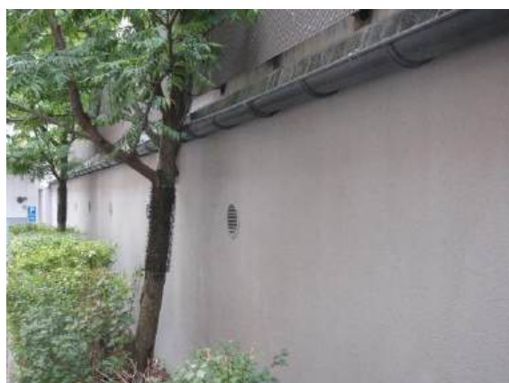
Träd som växer mot hängrännan och garaget.