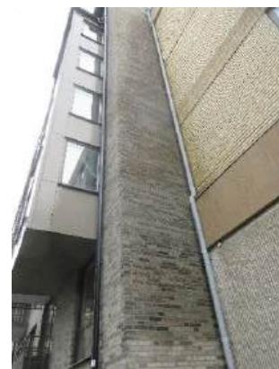
Tegelfasaden är blöt med risk för skador.