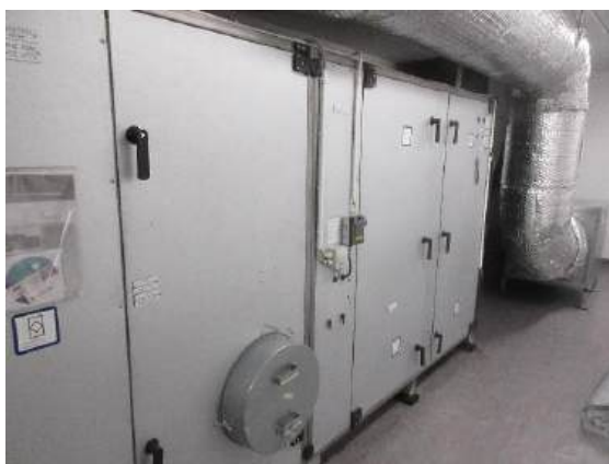
Ventilationsaggregat för bostäderna