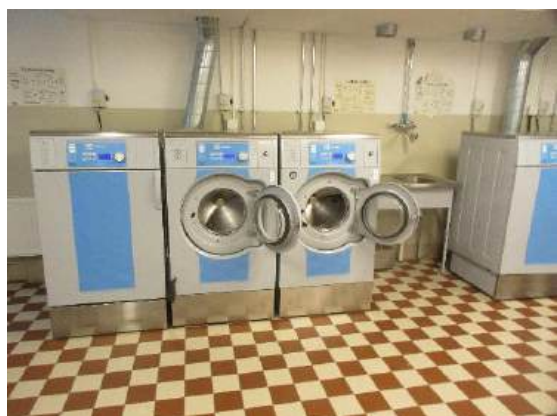
En del av tvättstugan