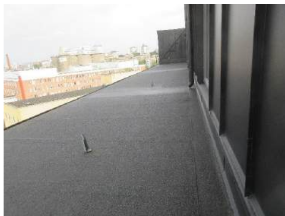
Del av yttertaket