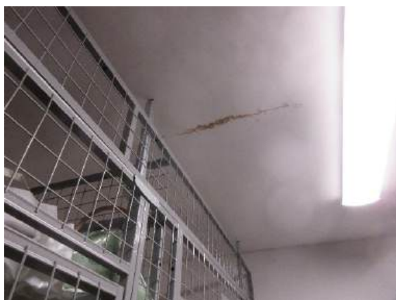
Tecken på takläckage