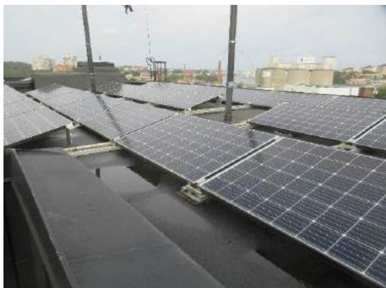
Solceller på taket