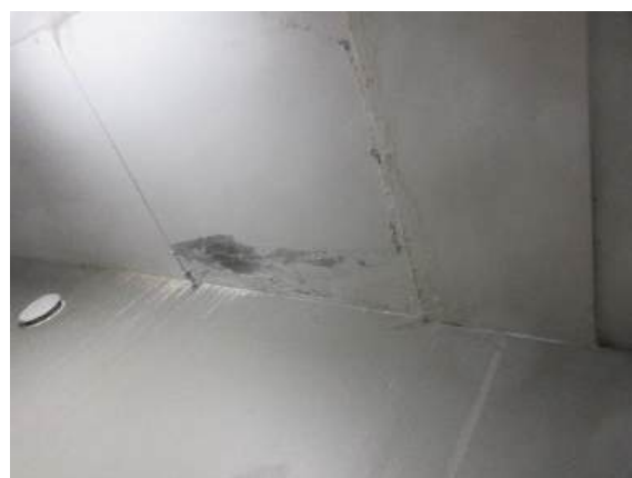
Läckage ner till garaget vid mur mot gatan