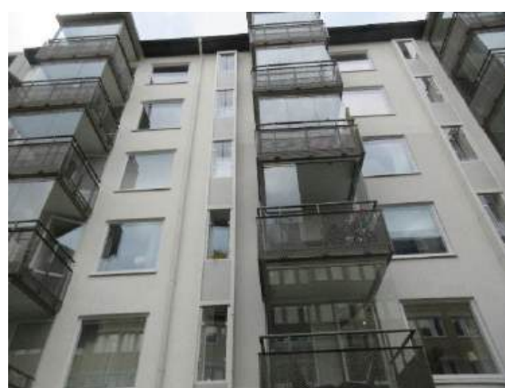
Fasad med inglasade balkonger